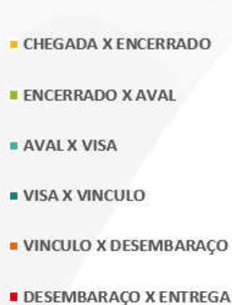
Tempos por Etapa – DI 2019